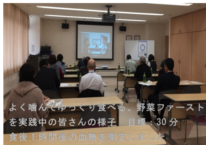
よく噛んでゆっくり食べる、野菜ファーストを実践中の皆さんの様子 目標：30分 食後1時間後の血糖を測定しました