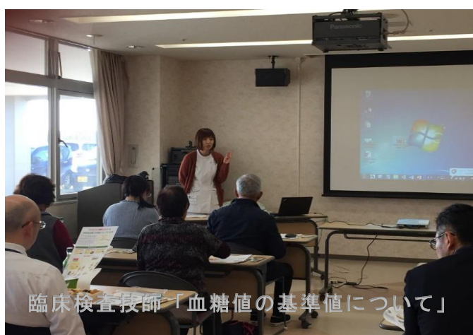
臨床検査技師「血糖値の基準値について」